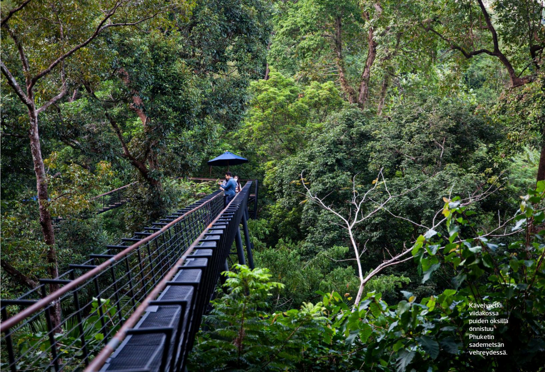
Kävelytie viidakossa puiden oksilla onnistuu Phuketin sademetsän vehreydessä.