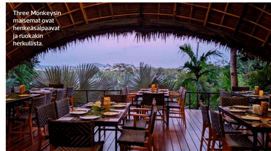
Three Monkeys -ravintola on rakennettu puuhun useaan eri kerrokseen.

mikki konsanaan, eivätkä thaimaalaiset asiakkaat ole moksiskaan.