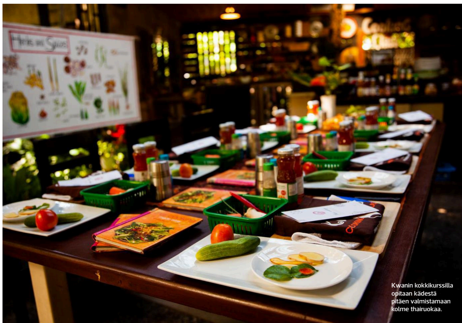
Kwanin kokkikursilla opitaan kädestä pitäen valmistamaan kolme thairuokaa.