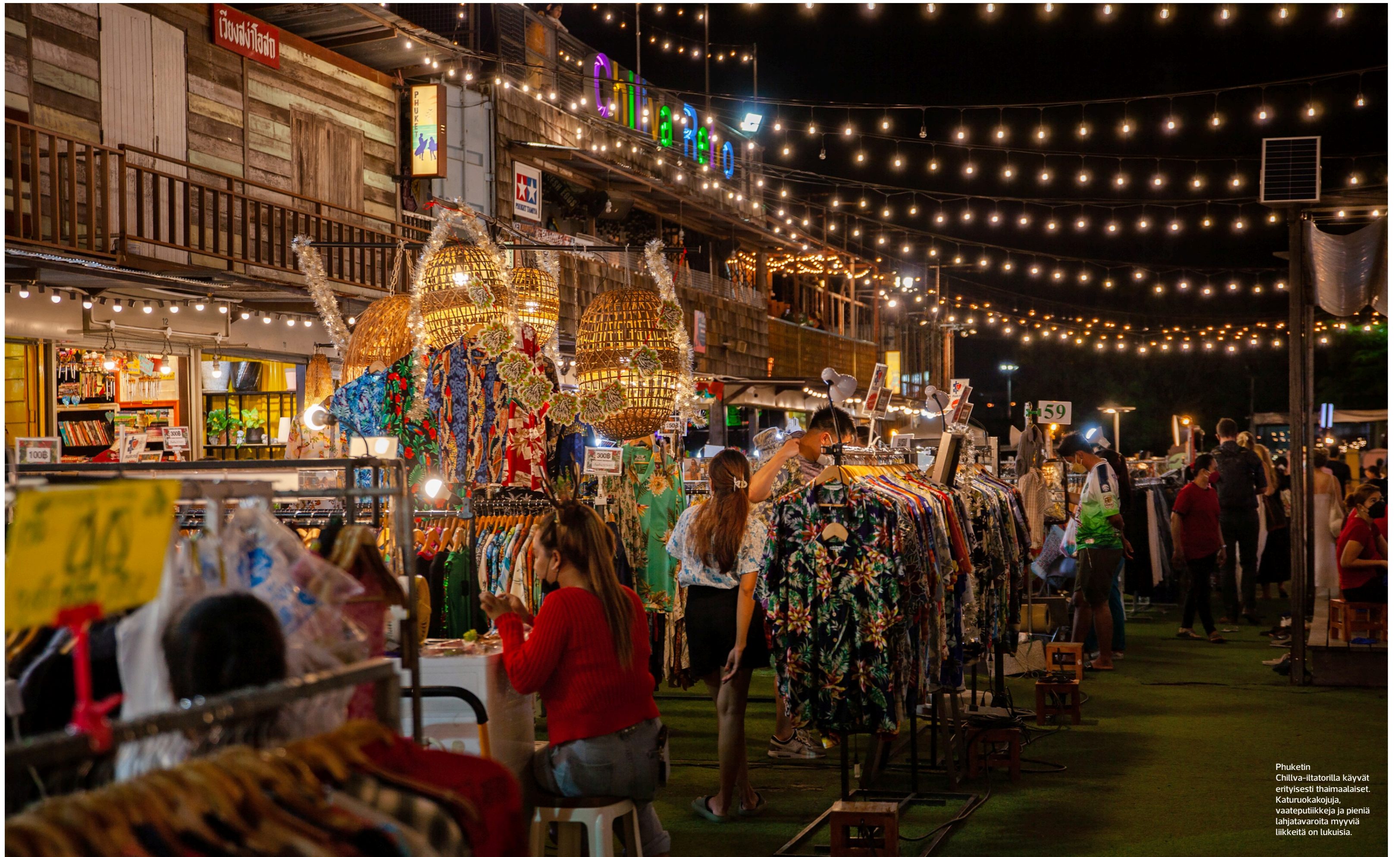
Phuketin Chillva-iltatorilla käyvät erityisesti thaimaalaiset. Katuruokakojuja, vaateputiikkeja ja pieniä lahjavaroita myyviä liikkeitä on lukuisia.