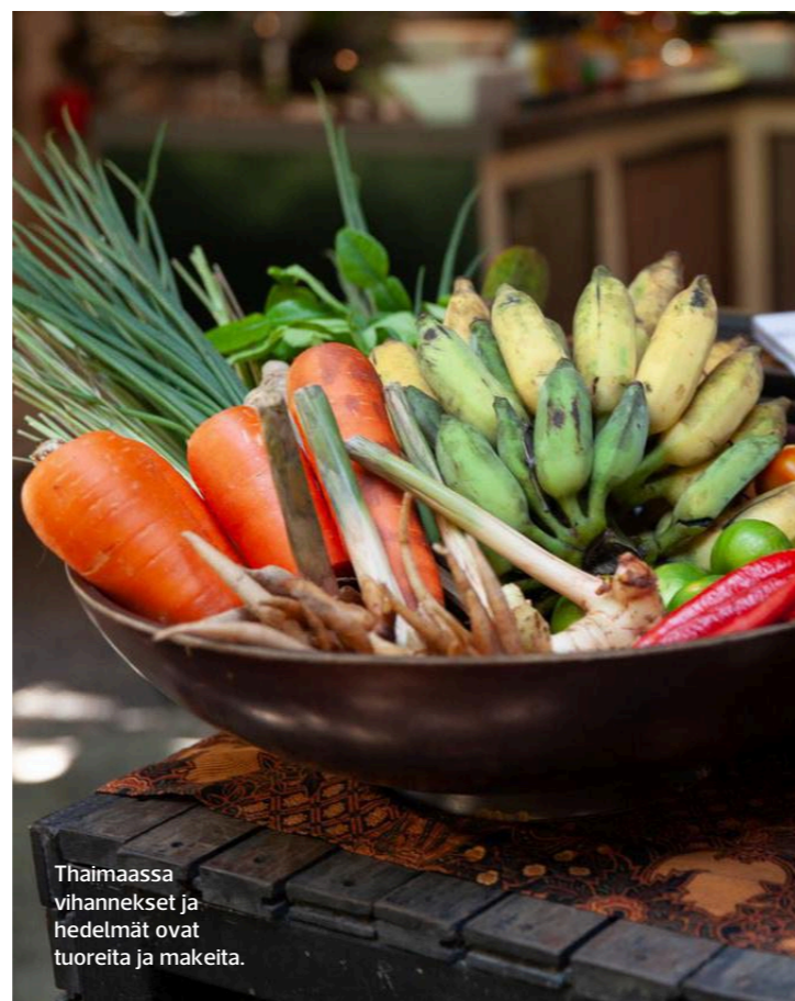
Thaimaassa vihannekset ja hedelmät ovat tuoreita ja makeita.