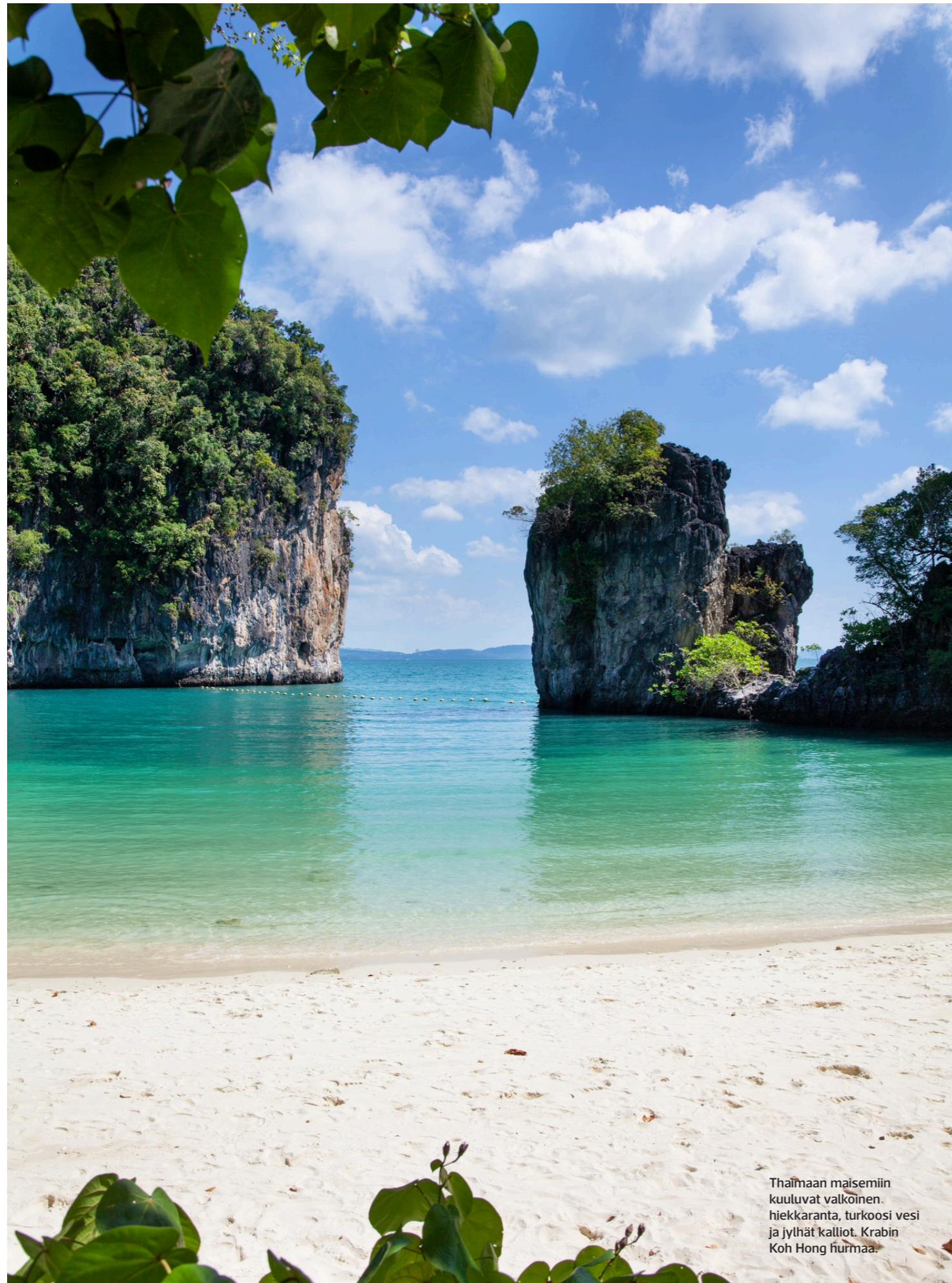
Thaimaan maisemiin kuuluvat valkoinen hiekkaranta, turkoosi vesi ja jythät kalliot. Krabin Koh Hong fiirmaa.