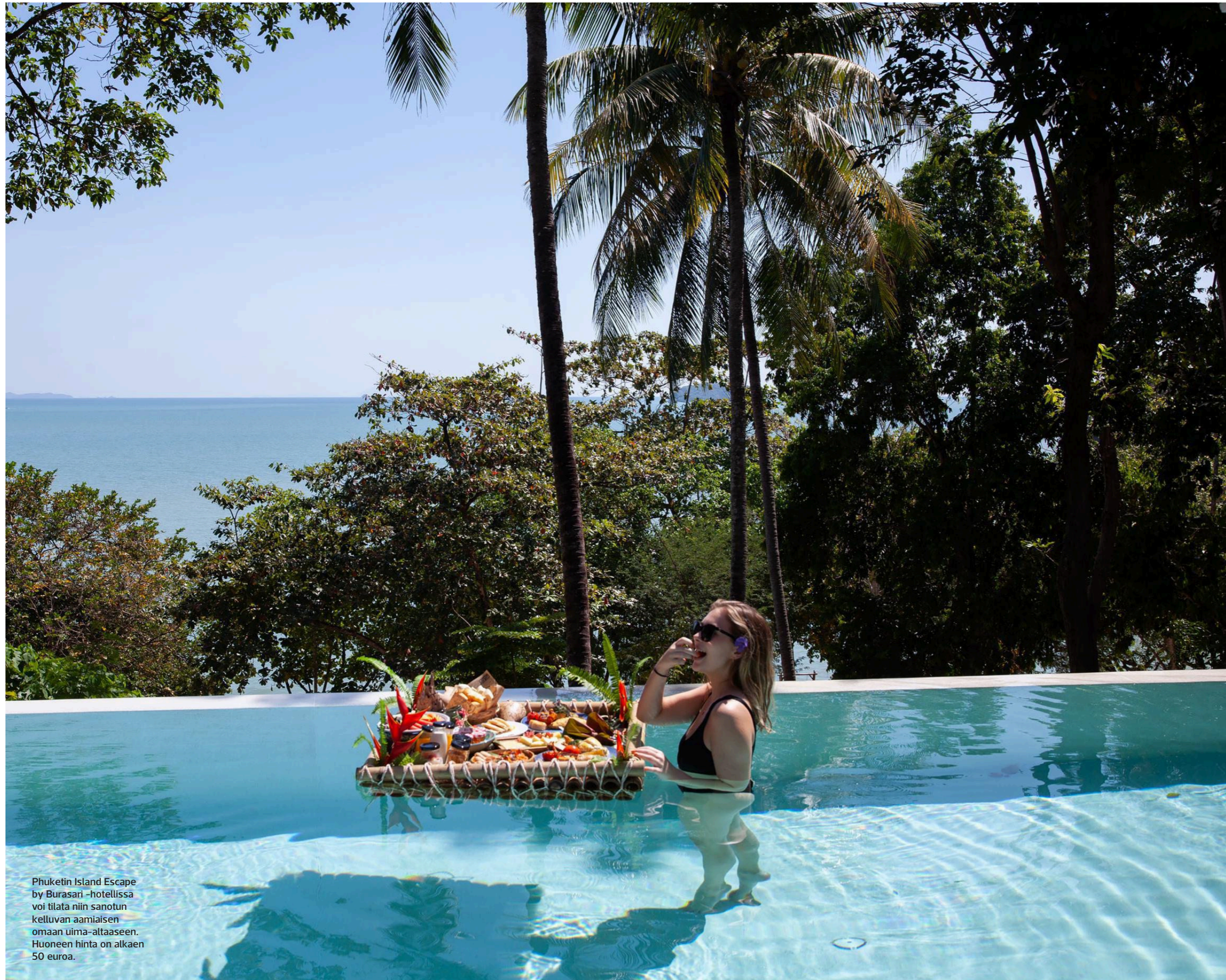
Phuketin Island Escape by Burasari -hotellissa voi tilata niin sanotun kelluvan aamiaisen omaan uima-altaaseen. Huoneen hinta on alkaen 50 euroa.